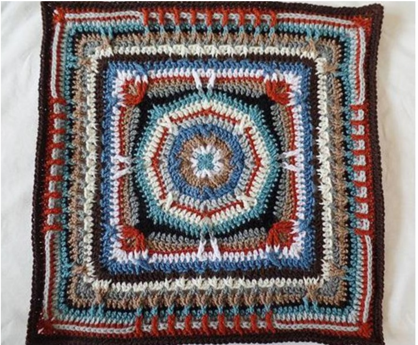
Het middelste vierkant